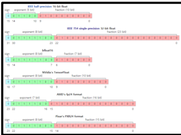
수를 표현하는 다양한 방법